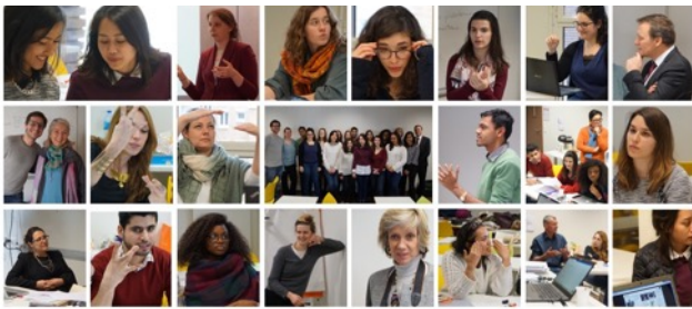
WORKSHOP "NETWORKING FOR A BETTER WORLD" Human Connection - Inalco Sorbonne Paris Cité Paris, March 18 th & 19 th 2016